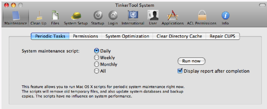
Figure 8.1. L'interface de TinkerTool System