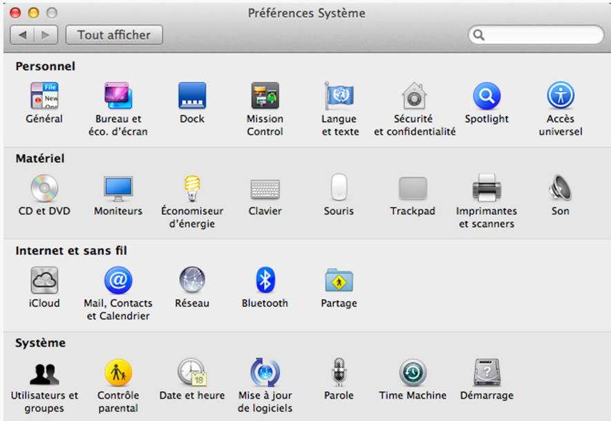
Figure 5.1. La fenêtre Préférences Système